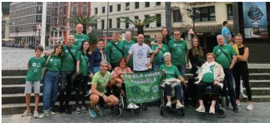
Parada para foto con las familias durante el maratón Getxo-Bilbao-Getxo