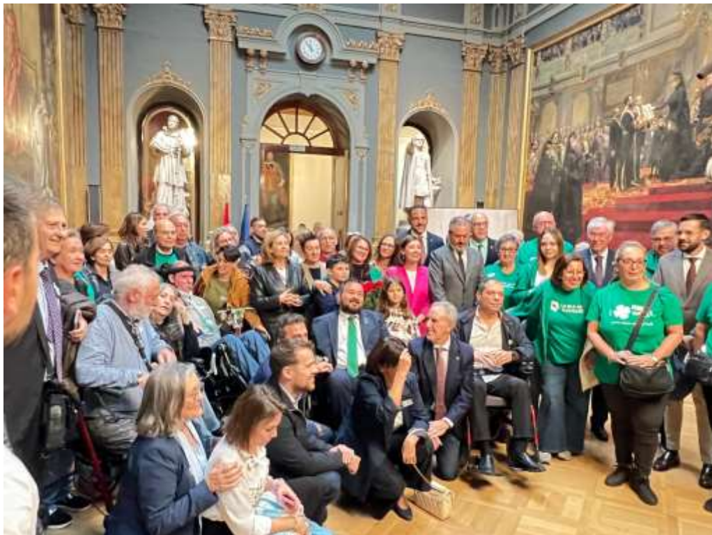
Reunión de Asociaciones y familias después de la aprobación final en el Senado