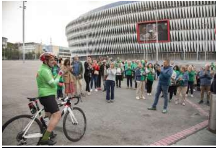
San Mamés – Meta