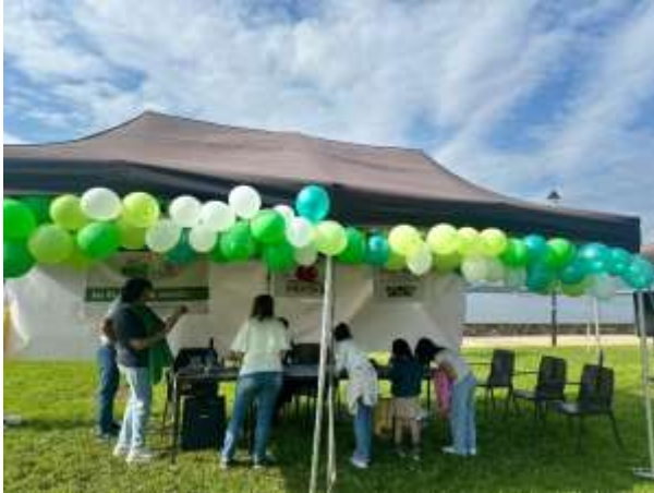
Montaje de la carpa